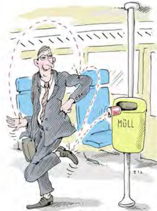
MÜLL? MÜLLER, THOMAS MÜLLER!

Im NRW-Nahverkehr auf der Schiene treffen täglich 2,4 Millionen Menschen aufeinander. Bei aller Unterschiedlichkeit haben die Fahrgäste ein gemeinsames Interesse: entspannt und komfortabel von A nach B zu reisen. Doch was für den einen komfortabel ist, kann für den anderen unangenehm oder sogar belästigend sein. Gegenseitige Rücksichtnahme macht die Bahnfahrt sehr viel angenehmer. Eigentlich weiß man das ja. Für notorisch Vergessliche verteilt die WestfalenBahn nun Hilfsmittel auf Karton: Der bekannte Karikaturist Til Mette, gebürtiger Bielefelder, hat für die WestfalenBahn die zehn „beliebtesten“ Unarten beim Pendeln karikiert, ART gegen Unart eben. Schmunzeln ist durchaus erwünscht! #MitRücksichtUnterwegs