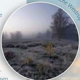
Die winterliche Westrupe Heide