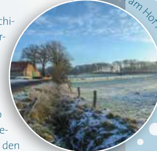
Winteridyll am Hof Remme