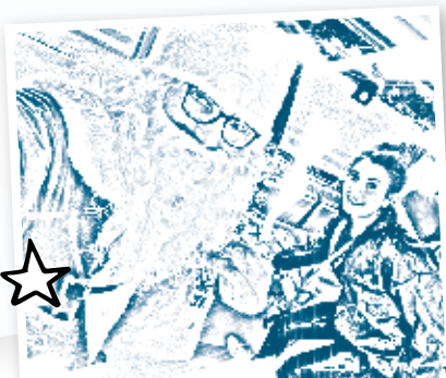
Der Nikolaus und seine Helfer überraschen Groß und Klein auch in diesem Jahr.

Unsere Mottozüge „Mit uns können Sie was erleben“ sind in der Vorweihnachtszeit wieder unterwegs. Mit der WestfalenBahn kommen Sie somit nicht nur zügig und bequem zum Ziel, sondern erleben schon die Fahrt als unterhaltsames Ereignis.