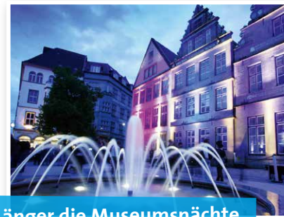
Länger die Museumsnächte genießen